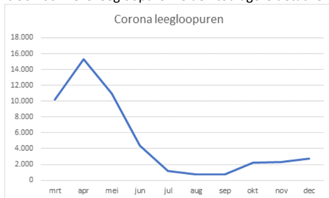
Aantal leegloopuren Wsw-gedetacheerden a.g.v. corona

Leegloopuren zijn uren van een Wsw-medewerker waarin geen productiviteit geleverd wordt. De leegloopuren zijn ontstaan in de eerste lock-downperiode. Een deel van de Wsw-medewerkers behoorde tot de risicogroep en moest noodgedwongen thuis blijven. Daarnaast moest een aantal bedrijven de deuren sluiten of eerst de nodige aanpassingen doen om de gedetacheerden een veilige werkplek te bieden. Inmiddels hebben de werkgevers de nodige aanpassingen gedaan en zijn de medewerkers grotendeels teruggekeerd naar de oorspronkelijke inlener. Het aantal uren dat gedetacheerde Wsw-medewerkers in een bepaalde periode niet werkzaam konden zijn, kende een sterke piek tijdens en direct na de eerste lockdown periode. Inmiddels is het aantal leegloopuren fors teruggelopen. Het totaal aantal leegloopuren is 50.700. Deze leegloopuren leiden tot lagere detacheringsoptbrengsten.